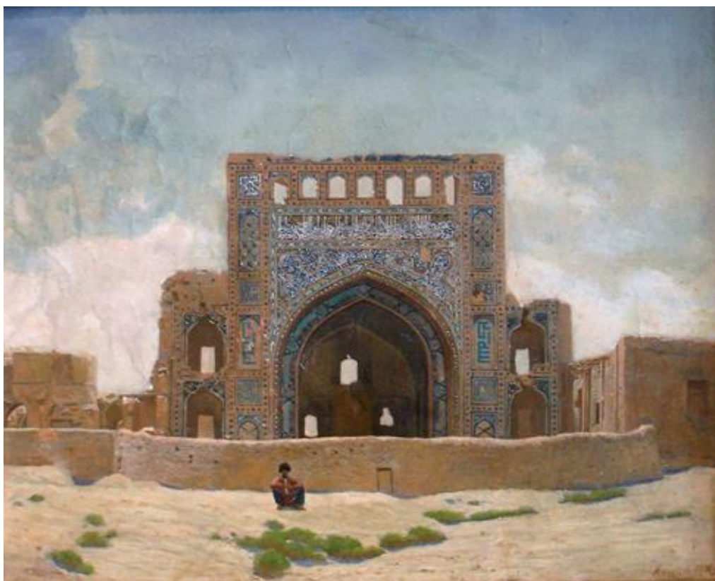
Рисунок 1. Константин Мишин. Мечеть Анау. 1902 г.

Первыми работами в жанре ведуты в туркменской живописи стали «Мечеть Анау» (1902 г.) (рисунок 1) Константина Мишина, «Мавзолей Тюрабек-ханым» (1952 г.) Айхана Хаджиева, «Куняургенч» (1962 г.) Бяшима Нурали, «Мечеть в Дашогузе» (1977 г.) Чары Амангельдыева, а также произведения на исторические темы, которые стали появляться в творчестве многих других туркменских художников. Вышеупомянутые художники также были первыми представителями жанра ведуты в туркменской национальной живописи.